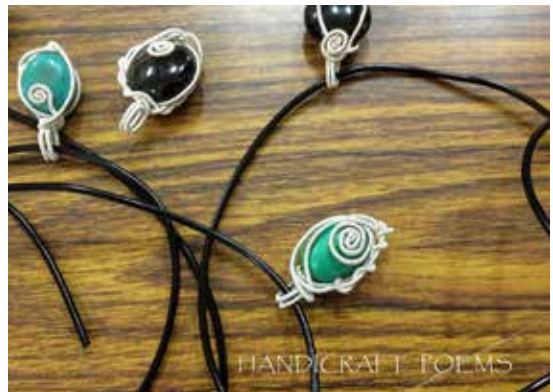
● 手作的詩擅長各種新創設計，細節處充滿巧思。