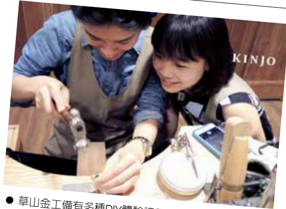
● 草山金工備有各種DIY體驗課程。