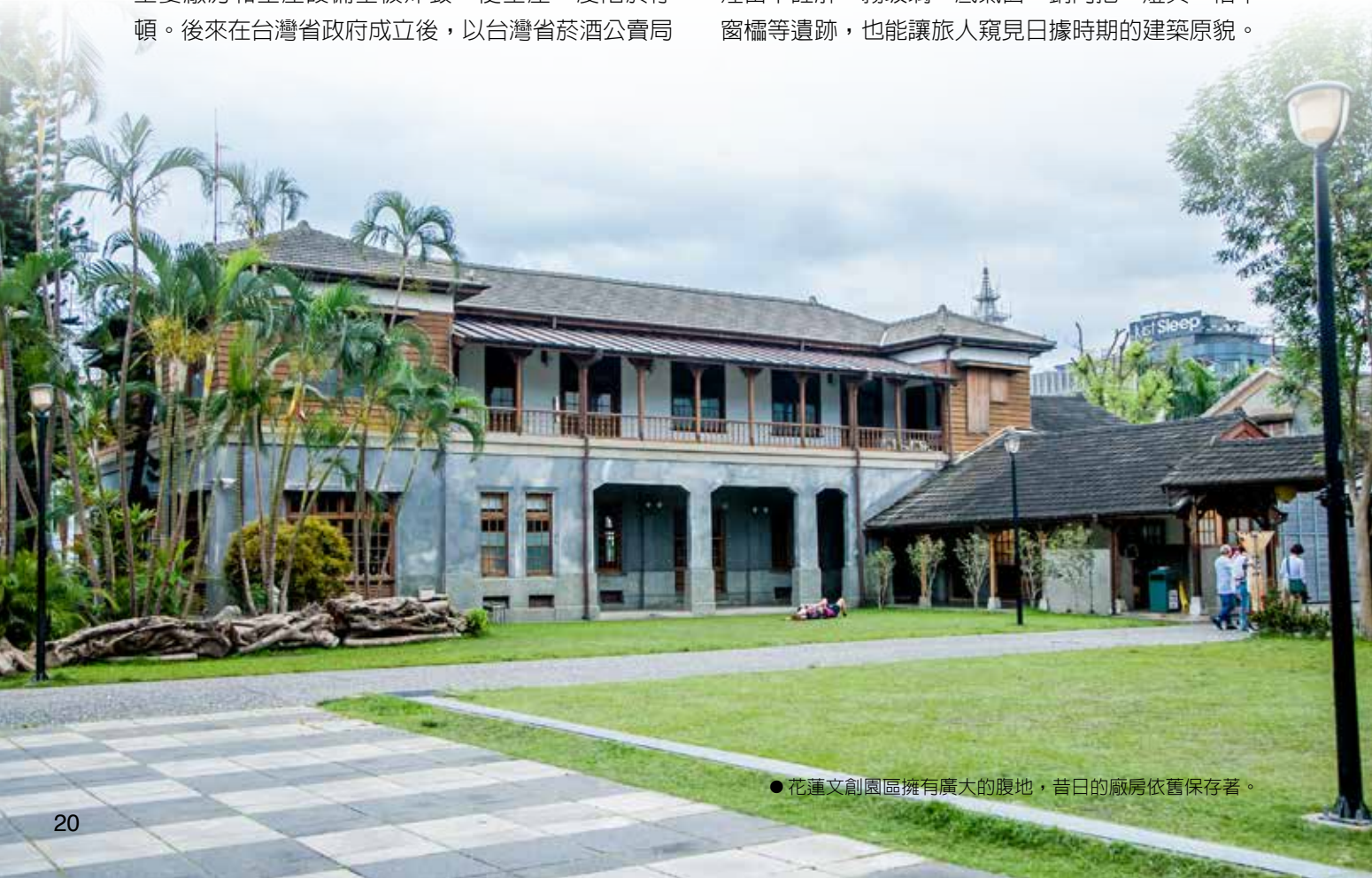
● 花蓮文創園區擁有廣大的腹地，昔日的廠房依舊保存著。

走進花蓮文創園區，高聳的煙囪為酒廠過往的輝煌留下註解，霧玻璃、底氣窗、銅門把、燈具、檜木窗櫺等遺跡，也能讓旅人窺見日據時期的建築原貌。