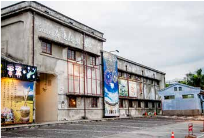
● 各式各樣的彩繪、展覽，為原先廢棄的廠房注入新的活力。