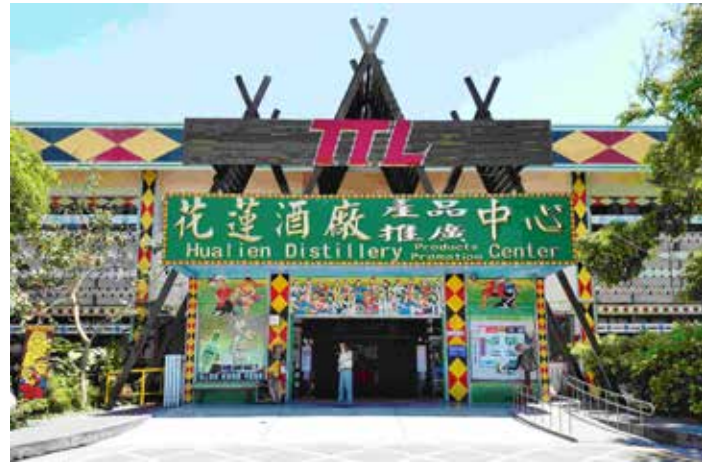
● 花蓮酒廠產品推廣中心，有著濃濃的原住民風情。

這裡的一磚一瓦、乃至窗戶通廊，都有各異其趣的特色，看外表似素樸，其實每個角度都能享有不同的景致與美感。穿梭在花蓮文創園區裡，彷彿跟上了後山花蓮的優閒步伐，值得一步步探索屬於它的故事。