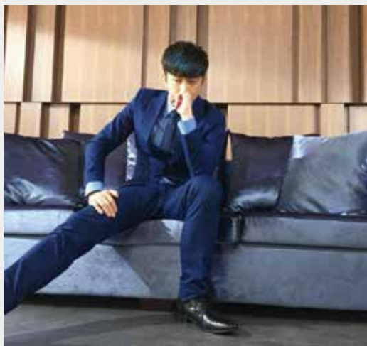
● 無論任何角色，漢典都認真揣摩，力求到位。