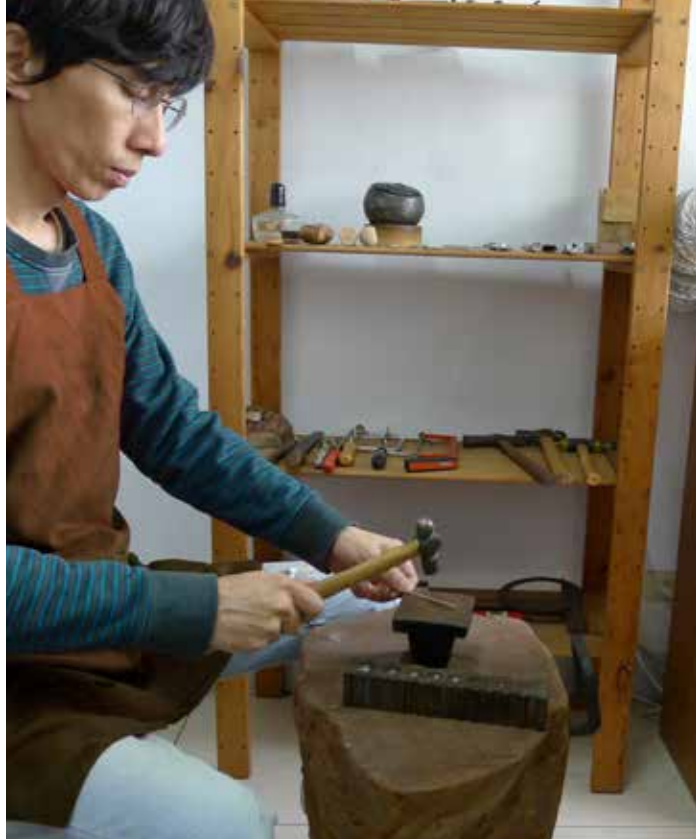
● SONO老師親自示範金工教學