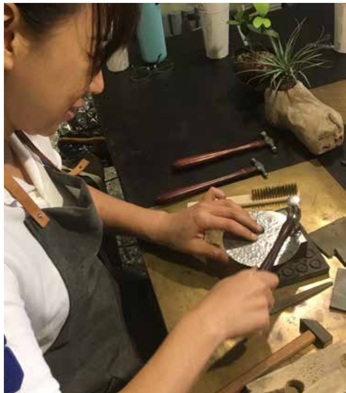
● 使用金工錘悉心敲打，來此能隨心所欲打造心目中的飾品。

手作的詩設計領域涵蓋非常廣，除了珠寶飾品，亦有複合媒材、天然漆器、生活用品開發等，結合藝術、時尚、童趣、生活等元素，讓所有創作都具有故事性，讓它們成為人與人幸福的媒介。戒指與手環是HANDICRAFT POEMS的熱門體驗項目，錫碟和茶則製作也非常有特色。目前DIY課程都採預約制，未來也將陸續推出新內容，致力將生活美學深耕於府城。