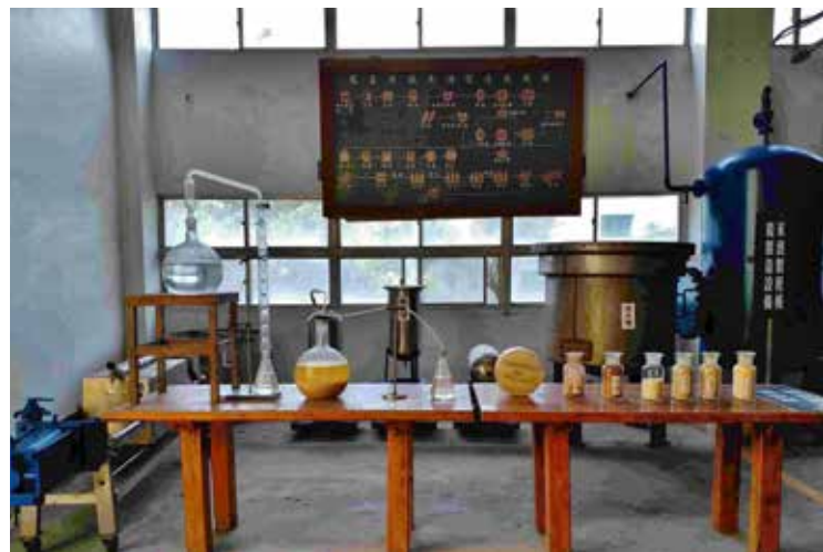
● 來到花蓮酒廠，可學習到米酒傳統製程的相關知識。

由蘇花公路開車一路南下，看到「北埔」的指標，便知花蓮市區已不遠，沿著台九線開設的中油北埔、新城、民益等加油站，都秉持著在地人的熱情，為來往旅人服務。在此稍作休息補充能量，消除旅途中的疲憊，再出發進入花蓮市區接續遊玩，是開車族的絕佳選擇！