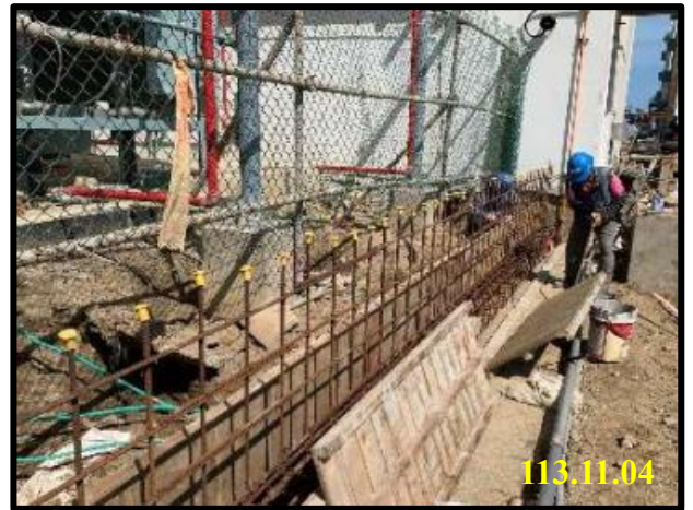
南側圍籬基礎牆模板組立