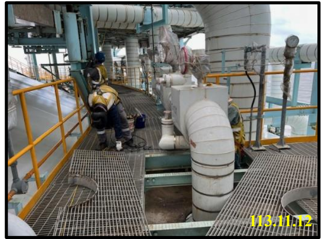
第 1 座儲槽 缺失改善