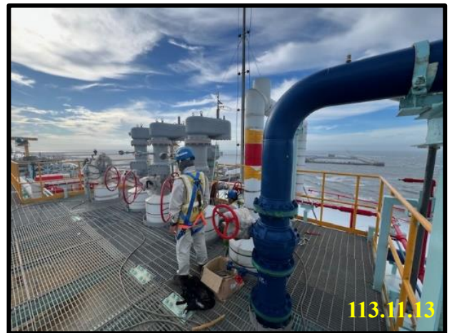
第 2 座儲槽 第三方校正