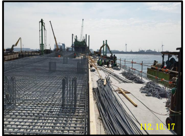
B21 堤面箱涵模板組立