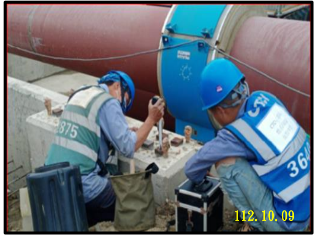
4000 區管墩鋼構灰誌施作

正進行主變電站防爆牆泥 作粉刷、製程變電站 3F 模 板拆除及外牆清潔、儲槽變 電站屋頂抽水及門檻安裝 作業、中央控制室牆防水施 作及 1F 泥作施工等工項。