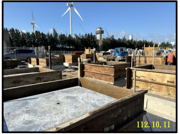
配氣站清管區管墩模板組立

正進行電廠一路北段預製管預製、控制室大門側圍牆牆身澆置、配氣站大門機電配管、隔離站試挖、污水管銜接及光纖地下管澆置等工項。