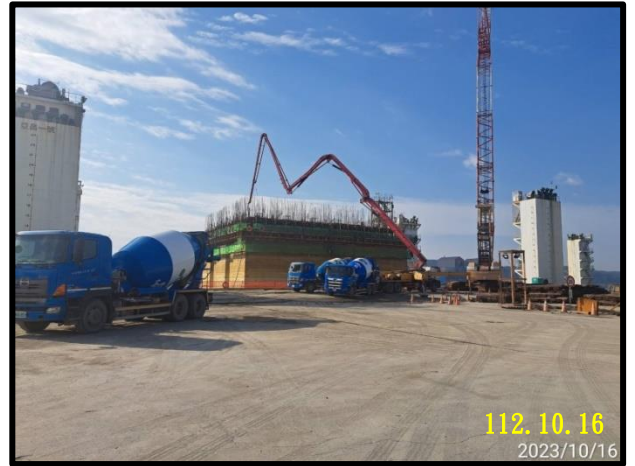
沉箱 (BE-62)滑模凝土澆置