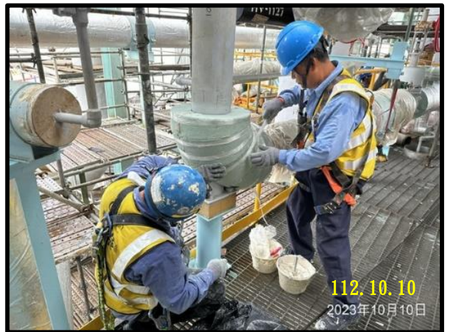
第 2 座儲槽 管線保冷施作