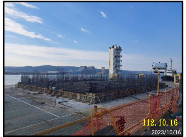
沉箱 (BE-65)底版基礎鋼筋綁紮