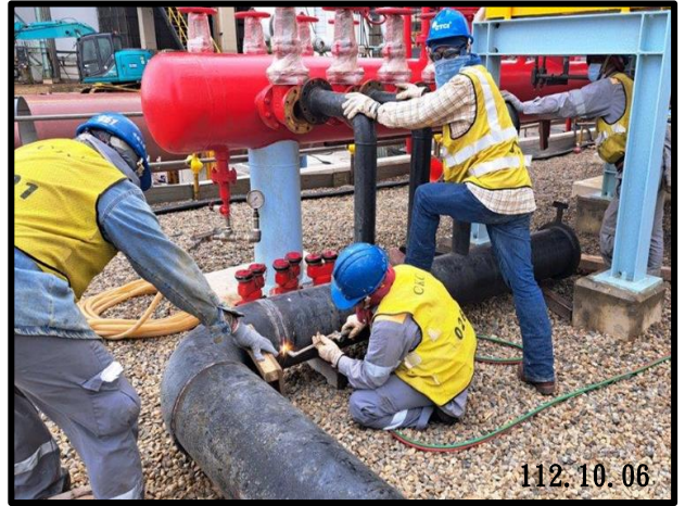
第 1 座儲槽 消防測試臨時管拆除