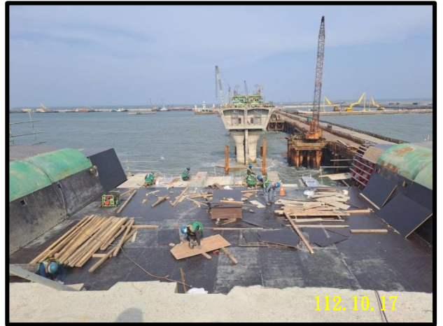
P6-P5 邊跨場撐段外腹板組裝

正進行P1-E/W-01 濕接縫模板組立、P2 柱頭節塊預力施拉、P3 箱室預力錨座水泥打除、P4 柱頭節塊立柱型鋼拆除等工項。