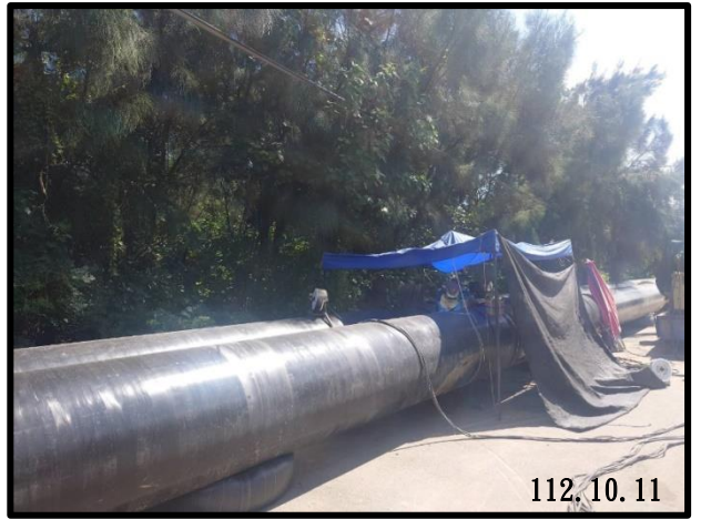
電廠一路北段預製管預製