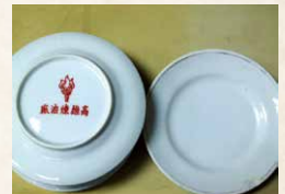
▲員工勞動生活文物—專用餐具。