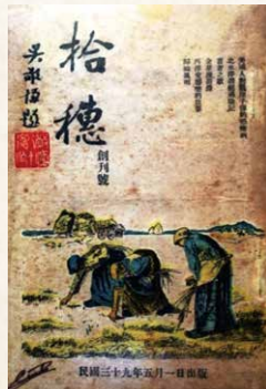
▲《拾穗》月刊創刊號封面。