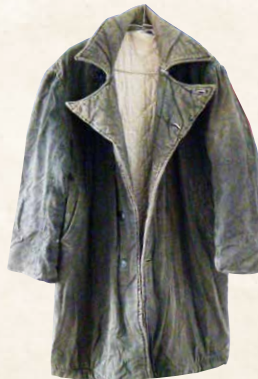
▲員工勞動生活文物—防寒大衣。