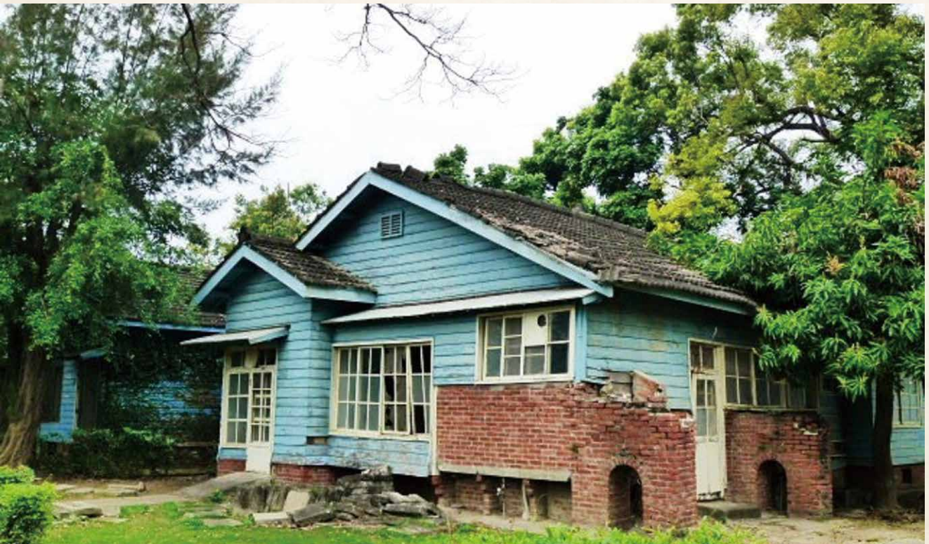
▲宏南舊丁種雙併宿舍市定古蹟。

市府公告後，本公司即依《古蹟修復及再利用辦法》，委託國立高雄大學進行調查研究。該研究曾就古蹟再利用提出「文史紀錄展覽空間」、「建築構造展示空間」、「藝術家駐點