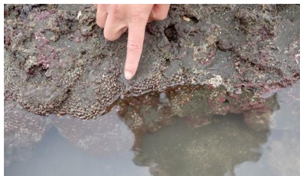
圖 1：本研究團隊在 2019 年 2 月份時於觀塘工業區 G2 海域藻礁上紀錄到的柴山多杯口珊瑚

桃園海岸的藻礁主要分布北起大園鄉竹圍漁港海岸，向南延伸至觀音鄉及新屋鄉永安漁港附近。依照碳十四定年的資料，這個地區最古老的藻礁為 7530 年前形成 (戴等 2009)。藻礁區除了鈣化藻以外，尚有豐富的底棲型生物存在，如軟體動物的螺貝類、甲殼類、與多毛類、環節動物等。特別的是，在 2017 年的 6 月期間報導在桃園的藻礁區發現了柴山多杯孔珊瑚(圖 1)。柴山多杯孔珊瑚 ( Polycyathus chaishanensis ) 最初在高雄柴山被發現，於民國 101 年正式發表為新種 (Lin et al. 2012)。這種珊瑚屬於刺絲胞動物門 (Cnidaria)、珊瑚綱 (Anthozoa)、六放珊瑚亞綱 (Hexacorallia)、石珊瑚目 (Scleractinia)、葵珊瑚科 (Caryophylliidae) 的成員 (Hoeksema and Cairns 2019)。在台灣，除了高雄柴山與桃園觀音沿岸藻礁區有紀錄過其分佈外，於台灣與離島沿岸海域其真正的族群與數量大小尚未進行全面性的了解。也由於這個種類很少被紀錄，因此被研究與報導的文獻甚少，對其在生物學、生態角色的扮演上的認識不多。由於本種珊瑚為行政院農業委員會公告的 (第 I 級) 瀕臨絕種保育類野生動物 (民國 108 年 1 月 9 日公告之海洋保育類野生動物名錄)，基於生物多樣性與基因多樣性的保育上，對這個物種做更廣泛與進一步的了解，具有重要的保育意義。