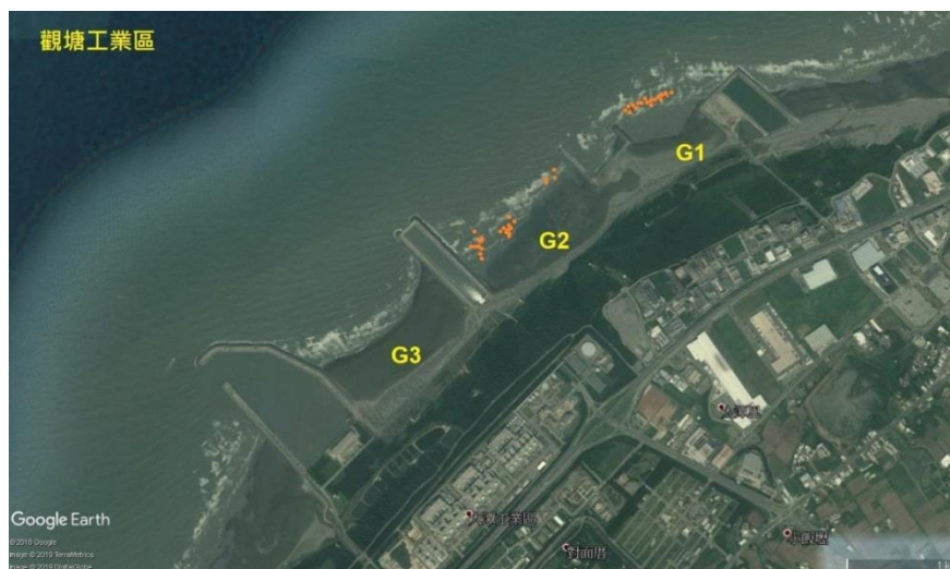
圖 2：觀塘工業區藻礁上紀錄到柴山多杯孔珊瑚分佈的地點(橘色圓點標示處)本圖資訊內容仿製於桃園市觀塘工業區開發計畫環境影響評估報告書圖 6.7-2

根據桃園市觀塘工業區開發計畫環境影響評估報告書(藻礁生態系因應對策暨環境影響差異分析報告,第六章 觀塘工業區藻礁生態環境現況)的內容所揭露,民國 107 年期間在觀塘工業區的藻礁分佈範圍內,於 G1 與 G2 區分別紀錄到 35 與 40 株的柴山多杯孔珊瑚。該報告亦對分佈的地點提供了全球定位系統(Global Positioning System, GPS) 的資訊可以追蹤珊瑚的位置(圖 2);此外對於柴山多杯孔珊瑚於藻礁區的特徵也有歸納性的敘述,在生物學上的相關資訊則未見報導。本監測計畫旨在透過針對柴山多杯孔珊瑚進行時間序列的影像紀錄,加以分析其珊瑚株的面積成長與水螅蟲數目增加的速率,並紀錄伴隨出現的生物以及其生長環境的特徵,以冀將來對於這個物種的保育工作貢獻基礎的生物學資料。