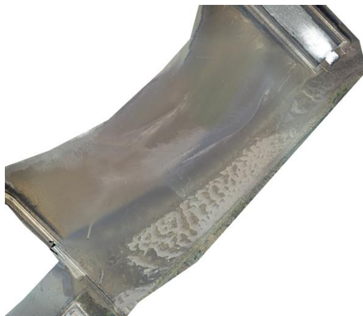
圖 5：本季大潭藻礁 G3 區空拍圖。

本次底表動物採樣於 109 年 2 月 13~14 日進行，共採樣 36 個測站共 108 個樣本。在進行調查時，發現大潭藻礁區之 G3 區目前全區覆沙(圖 5)，無礁體可供底棲動物調查，因此，目前的調查記錄不含此區域，日後如本(G3)區出現藻礁生態，再將此區納入調查範圍。