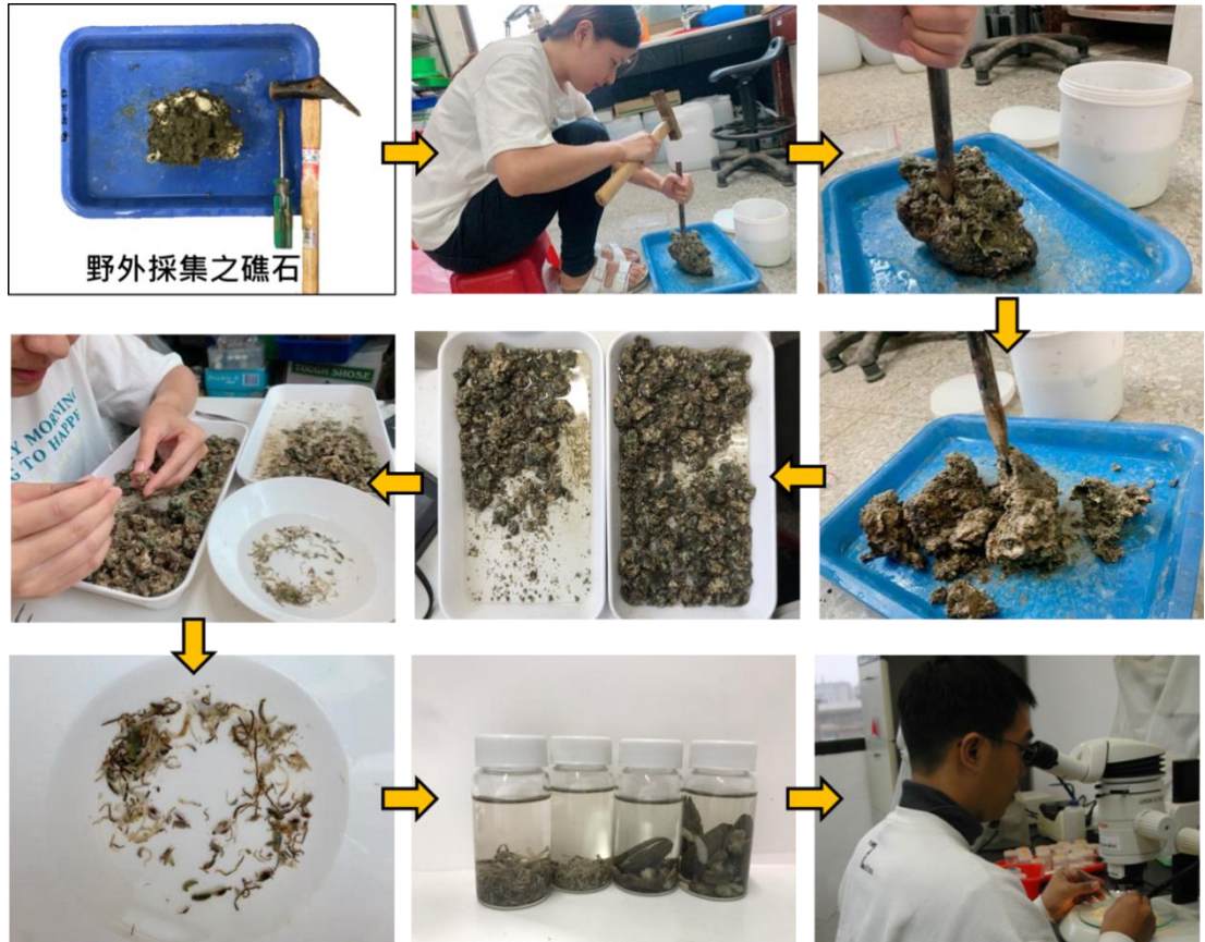
圖 4：藻礁底內動物樣品處理程序