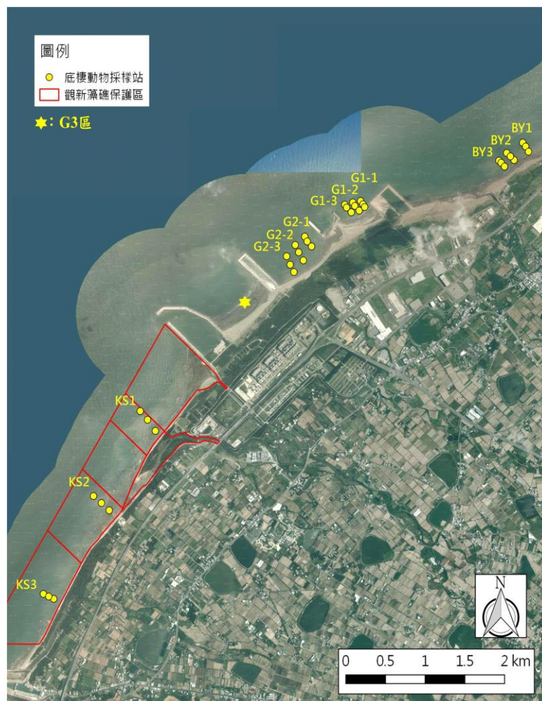
圖 2：本計畫大型藻類(黃+紅色)與底棲動物調查(黃色)之穿越線預定位置

每一區塊在平行海岸線設置至少 3 條與海岸垂直之穿越線，每條穿越線約為 150-200 公尺長，而在 G1 區及 G2 區各設 3 條穿越線，觀新藻礁區及白玉藻礁區各設 3 條穿越線，共計 12 條穿越線。穿越線預定位置如圖 2。在藻礁地形依潮間帶寬度就高 (H)、中 (M)、低 (L) 潮帶設置三個測站，各測站位置之座標如表 1。底棲動物之調查頻率為每季 1 次，共計 4 次。