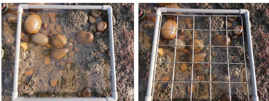
圖 2、桃園藻礁底棲動物調查使用之方框

沿各穿越線依高、中與低潮位，在各潮位藻礁上採集一塊約 10 \times 10 cm 大小的礁體，於現地先以少量薄荷腦麻醉礁體中之軟體動物或環節動物等易受損之生物，再以濃度 75% 之酒精溶液進行固定，再將礁體攜回實驗室做進一步的鑑定與分析。底內動物的處理過程相當冗長而繁複 (圖 3)，取回之礁體首先以鑿子敲成小塊後，再以鑷子除一挑出其中縫隙所躲藏之無脊椎動物，將生物體置於 75% 酒精保存後，再以顯微鏡進行分類、鑑定、計算物種數及個體數。