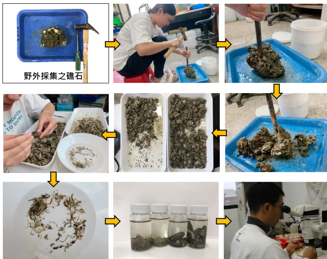
圖 3、桃園藻礁底內動物樣品處理程序