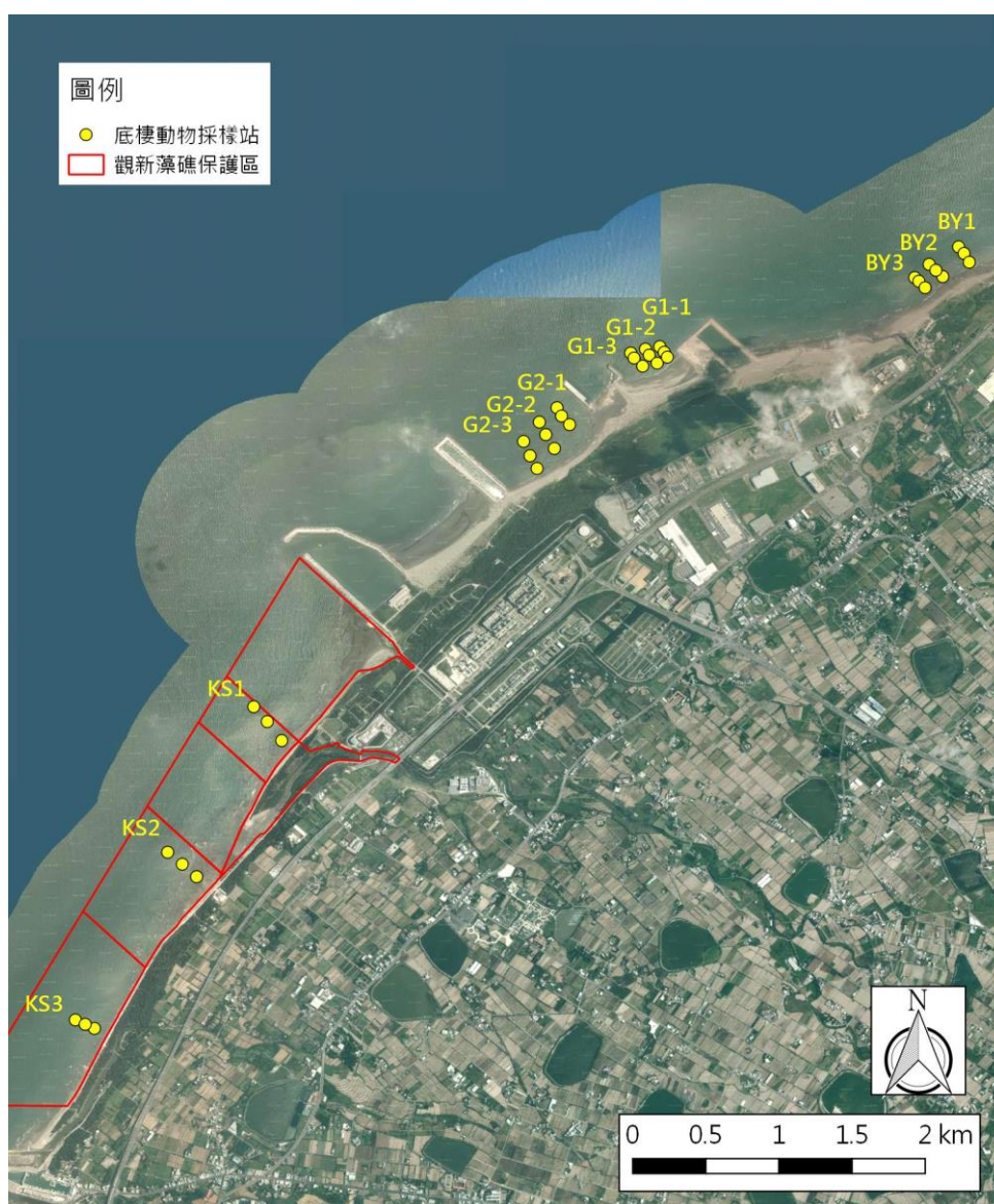
圖 2、底棲動物與環境因子調查之採樣站位置

每一區塊在平行海岸線設置至少 3 條與海岸垂直之穿越線，每條穿越線約為 150-200 公尺長，其中觀塘工業區之 G1 區及 G2 區各設 3 條穿越線，觀新藻礁區及白玉藻礁區各設 3 條穿越線，共計 12 條穿越線。穿越線預定位置如圖 2。在藻礁地形依潮間帶寬度就高 (H)、中 (M)、低 (L) 潮帶設置三個測站。底棲動物之調查頻率為每季 1 次。