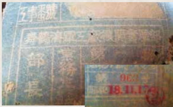
▲昭和 18 年「舞鶴軍工廠」的藍曬圖訴說了「六燃」肩負提供海軍軍艦燃料的使命。

賓果廠長自北京清華大學化學系畢業，家境清貧多半工半讀，民國 21 年以第一名成績畢業，民國 26 年以獎學金出國深造並獲得燃料化工博