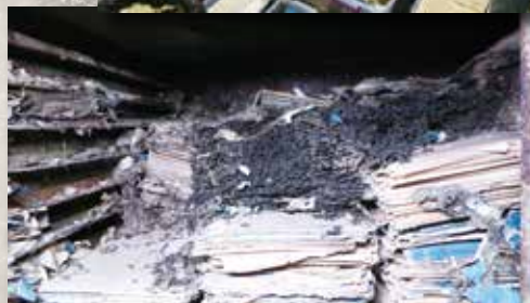
▲一直期待著下一批的藍曬圖會更完整，但迎來的卻是更多的白蟻更潮濕軟爛的藍曬圖。