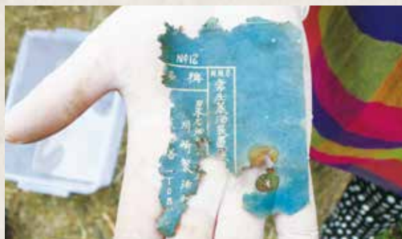
▲雖不完整，但清晰的「日本石油株式會社」訴說了高廠的前身。