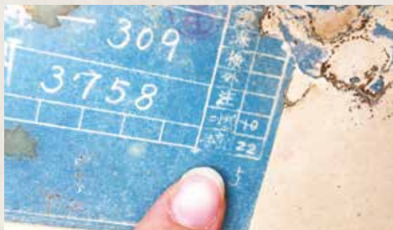
▲藍曬圖上小小的「二燃」透露著「六燃」複製二燃設備方式建造。

機關實驗部」，以及昭和 19 年 11 月的藍曬圖，圖上標示著「二燃」，正驗證林身振、林炳炎先生所著《第六海軍燃料廠探索》一書對於六燃、二燃所描繪之歷史。