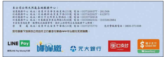
圖 3 寄送用戶之信封

本公司民生用戶之天然氣費用行動支付管道自民國 109 年 9 月 11 日起至 11 月 30 日止，計有六家行動支付業者已逐步上線完成：嗶嗶繳、Line Pay Money、元大銀行行動銀行、街口支付、橘子支付、新光銀行行動銀行等，介接的支付業者陸續增加中。目前行動支付繳費功能上線後，行動支付繳費筆數比例約為 1.8%。用戶繳費型態未來將持續觀察，藉以規劃該項業務未來之發展。