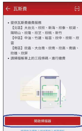
圖 2 行動支付（街口）繳費示意圖