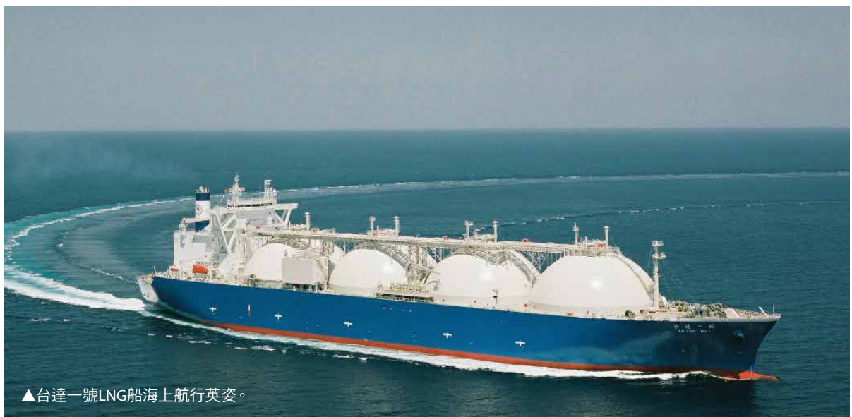
▲台達一號LNG船海上航行英姿。

船 舶投資案涉及造船等海事工程，以液化天然氣（LNG）運輸船為例，每船造價約 2 ~ 3 億美元，所需資金龐大，且回收期較長（通常 20 ~ 30 年），屬高風險專案，如具備長期穩定租約可供收益保障，銀行通常評估採用「專案融資」辦理授信。