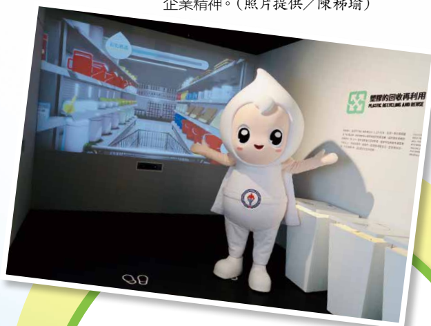
▼歐力分享追求潔淨能源、永續發展的企業精神。

歐力誕生於石油探索館，未來更將延伸代言，扮演著引領及整合本公司分布於全台各展館之任務，成為各單位展館共同的吉祥物。歐力將進一步變裝，展演各館特色，形塑出不同的風貌，在苗栗出磺坑「油礦陳列館」的歐力或許以探勘造型，訴說石油產業歷史，盡顯在地風華的形象；來到探探研究所之「探探科技展示館」則是專業、知性，充滿學術風的歐力；永安天然氣事業部「元氣生活館」的歐力，則凸顯潔淨能源與海洋交織而成的無限可能…期待不久將可以見到百變風貌卻一樣可愛的歐力，如同台灣中油各展館特色雖異卻又一脈相承。📍