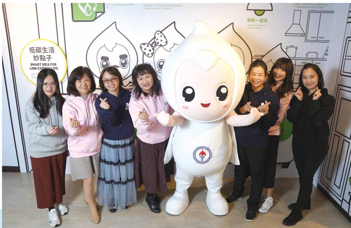
▲歐力與石油探索館的團隊。

「大家好，歡迎來到石油探索館」，一進入台北中油大樓石油探索館，在 270 度的環型劇場裡，清脆可愛的童音，伴隨著色彩繽紛的動畫，娓娓訴說石油的故事，而後戴著黃色安全帽、繫著白色披風一身雪白的小娃娃從墨黑的油滴中飛出，向來賓們正式問候，帶領大