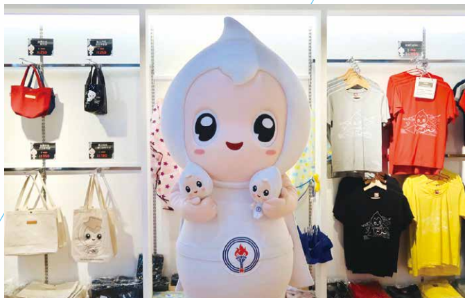
▲石油探索館展售的歐力文創產品。