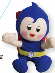
▶第一代石油展示館 吉祥物「多多」。