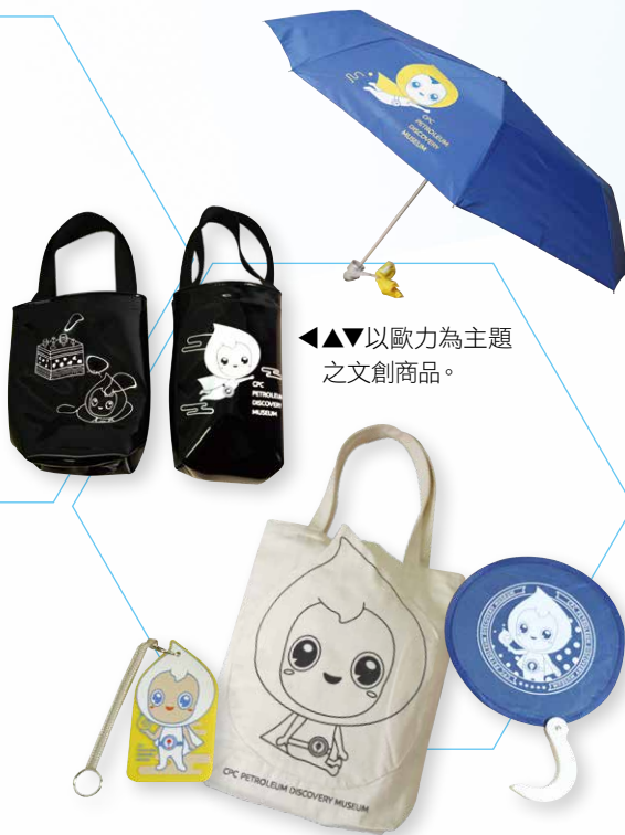
◀▲▼以歐力為主題 之文創商品。

名為「歐力小舖」，並推出以歐力為主題的系列產品，讓來賓們對歐力留下深刻的印象。萌翻的歐力也迅速擄獲人心，自出道以來邀約不斷，出席包括人力資源處訓練所等公司各單位之展覽及宣傳活動，不但站上去年國慶花車舞台，還參與公司形象廣告拍攝，儼然成為信義區的熊本熊。