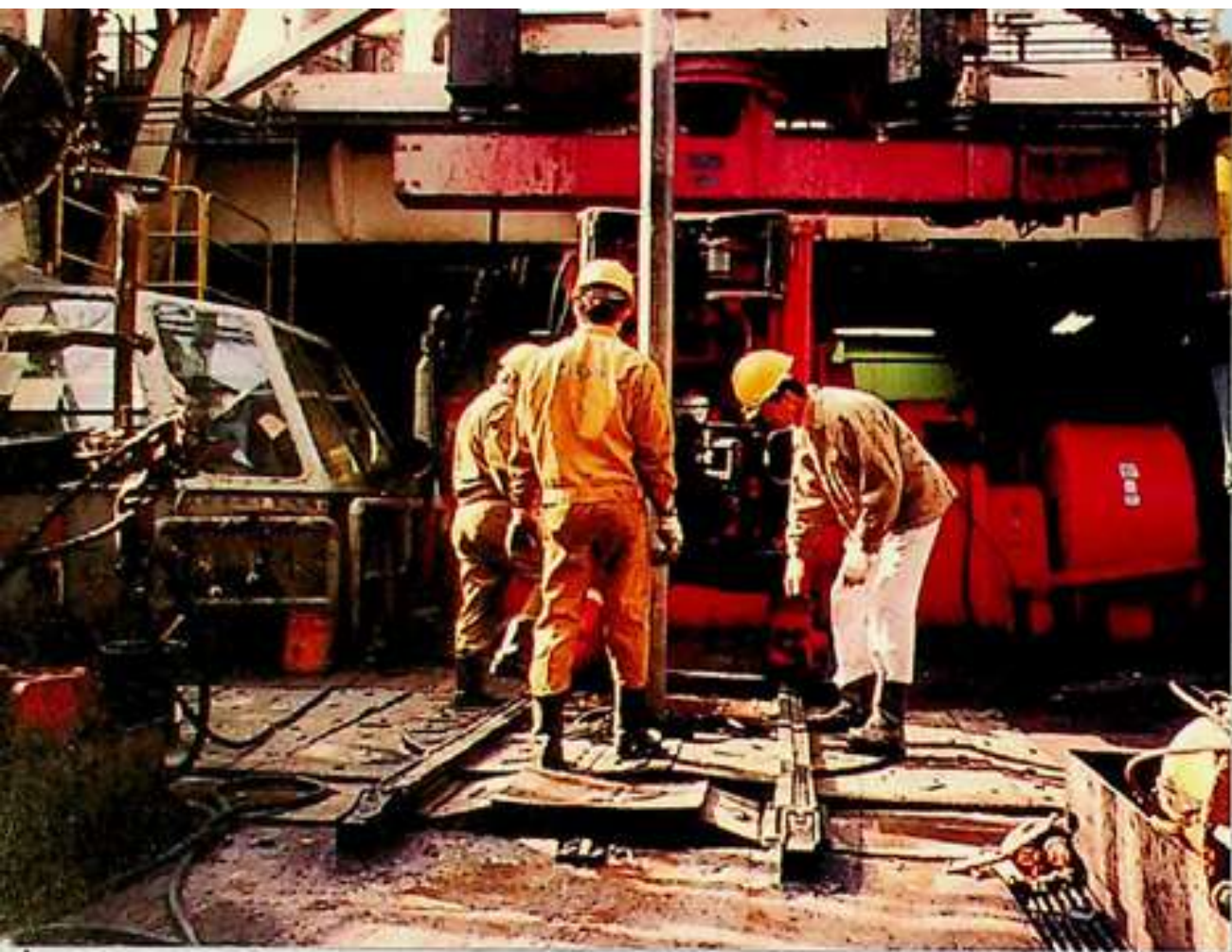
耐購易洗的工作服可使工作人員無「後」顧之憂。